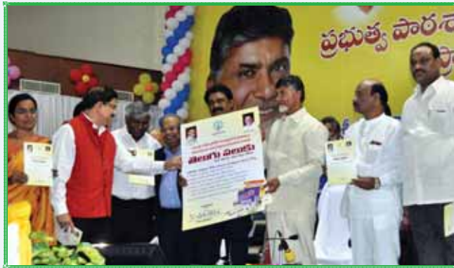
విశాఖపట్టణంలో ఆంధ్రప్రదేశ్ ప్రభుత్వం-పాఠశాల భాగస్వామ్యంతో 'తెలుగు పలుకు' కోర్సును ప్రారంభిస్తున్న ముఖ్యమంత్రి శ్రీ చంద్రబాబు నాయుడు