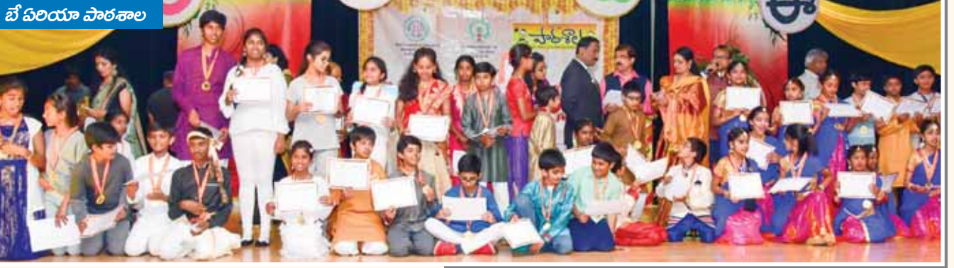
బే వలియా వారసాల

వారసాల 4 సంవత్సరాలుగా వసంతోత్సవం (Annual Day) వేడుకలను వివిధ కేంద్రాల్లో ఘనంగా జరుపుకుంటోంది. తెలుగు పండుగలా సాగే ఈ వేడుకలలో వారసాల పిల్లలు సాంస్కృతిక కార్యక్రమాలలో పాల్గొనటమే కాకుండా సర్టిఫికేట్స్ తీసుకుని గ్రాడ్యుయేషన్ వాక్ చేసి అందరినీ అలరిస్తారు.