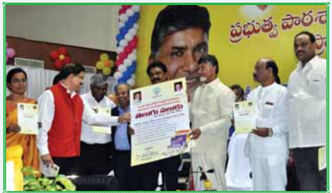
విశాఖపట్టణంలో ఆంధ్రప్రదేశ్ ప్రభుత్వం-పాఠశాల భాగస్వామ్యంతో 'తెలుగు పలుకు' కోర్సును ప్రారంభిస్తున్న ముఖ్యమంత్రి శ్రీ చంద్రబాబు నాయుడు